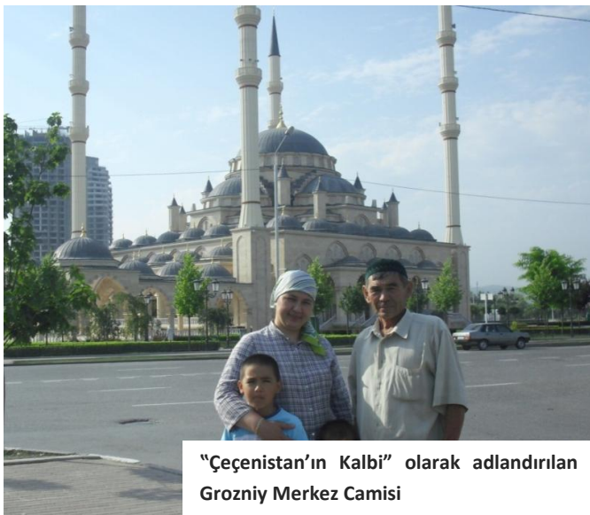
"Çeçenistan'ın Kalbi" olarak adlandırılan Grozniy Merkez Camisi

Nogayların millî yemeklerinin benzerlerini Orta Asya, Volga Havzası ve Kuzey Kafkasya'daki topluluklarda da görmekteyiz: Besbarmak (ıncal), şaşlık (şiş kebab), mantı , laksa , kurleme , kaurma , şir börek , boursak , kasık börek , toltırma (doldurma), kımız , yoğurt ve ayran gibi (Kalmikov vd. 1988: 30) Nogayların sevdiği yiyecek ve içecekler Kuzey Kafkasya'da yaşayan birçok topluluğun da rağbet ettiği görülmektedir. Ancak Nogayların içtiği çay başka kültürlerde çok fazla görülmemektedir. Şöyle ki 'Nogay çayı', 'Kalmuk çayı' olarak da isimlendirilir. Bu çaya süt, tuz, tereyağı ve karabiber konulur.