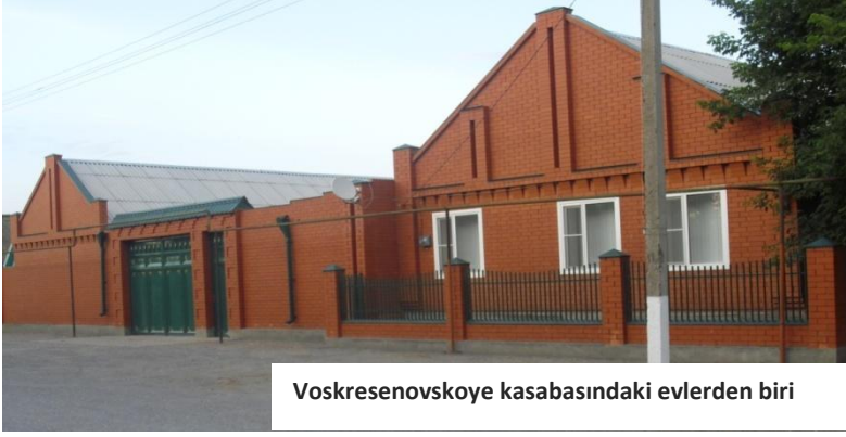
Voskresenovskoye kasabasındaki evlerden biri

form içinde de olsa İkinci Dünya Savaşı'nın sonrasına kadar varlığını sürdürdü' (Alpargu 2007: 175). Kalmıkov vd. 1988'e göre ise büyük ailelerin dağılmasının en önemli sebeplerinden biri yukarıda belirtildiği gibi kapitalist ilişkilerdir. Çocuklar finans kaynaklarının tek bir atanın