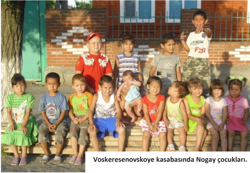
Voskresenovskoye kasabasında Nogay çocukları.

Araştırmacıların belirttiklerine göre eski dönemlerde olduğu gibi günümüzde de Nogaylar üç kuşak bir arada yaşamaktadır. Şöyle ki Alpargu'ya göre "Büyük ve ayrılmaz aileleri anlatmak maksadıyla Nogaylar 'üyken ayel' terimini kullanmaktadırlar. Bununla birlikte 'bir kazan ayel' (bir kazanın üyeleri) ya da bir kazandan yemek yiyenler terimleri ile de büyük evde bulunanların vasıflandırıldığı anlaşılmaktadır. /.../ Büyük aile içinde olan Bozkır Nogayları önceleri yurtlarda, ancak XIX. yüzyılın sonundan itibaren uzun kerpiç evlerde hayatlarını sürdürmekteydiler. Ev ile ilgili çeşitli terimler de evle ilgili çeşitli unsurları göstermek için kullanılıyordu. 'Üyken üy' (büyük ev), 'otav üy' (yeni evliler evi), 'kazan üy' (mutfak) gibi, ayrıca yaşlıların da bir bölümü bulunmaktaydı" (Alpargu 2007: 174). Ayrıca Sami Nogay'a göre "aile kendi içinde hiyerarşik bir karakter göstermektedir. Ailenin reisi 'atay' diye isimlendirilmekteydi. Atay, ata kelimesinden türetilmiştir. Ailede 'atay' dededir. Kazaklar, Kalmuklar, Büryatlar ve diğer bozkır topluluklarında amca da önemlidir. Eğer baba veya dede yoksa ailenin atayı veya diğer bir deyimle reisi amca olur" (Nogay 1997: 65–66).